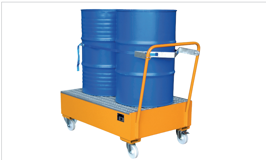
S 2020 mit Halterung und Spanngurt (Zubehör)