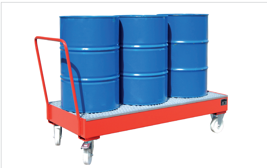
S 2050 SR