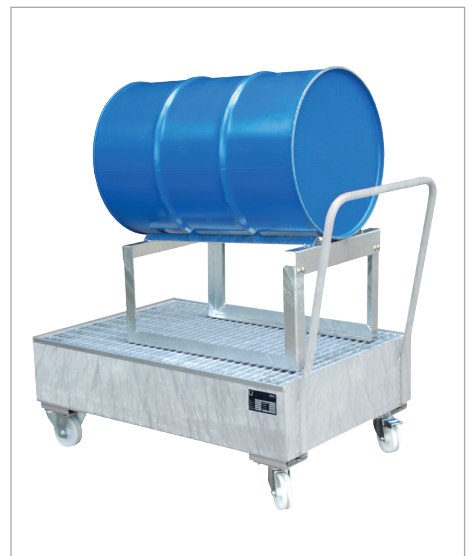
S 2020 mit Fassauflage Typ FA 200 (Zubehör)